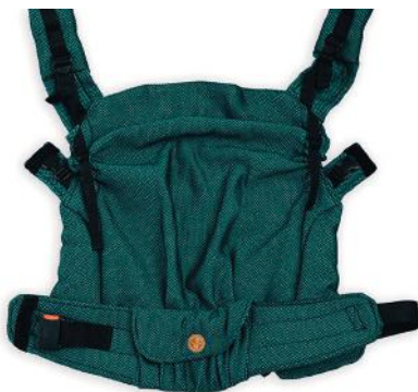
Regulacja wysokości panelu Adjustment of the height of the carrier's panel